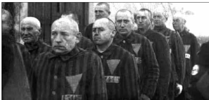
나치 수용소의 동성애자들. 분홍색 삼각형이 그들의 표식이었다.

가들이 대거 검거돼 수용소로 보내졌다. 가스실에서 동성애자 수십만 명을 포함해 수백만 명이 목숨을 잃었다. 오늘날 동성애자의 상징으로 쓰이는 분홍 삼각형은 히틀러의 수용소에 갇힌 동성애자들이 달았던 표식에서 기원한 것이다.