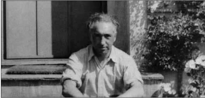
공산주의적 실천과 성 해방의 결합을 주장한 빌헬름 라이히(1897~1957)

다)는 특히 공산주의 청년 동맹에 영향력이 있었다. 신입 청년들은 레닌의 《국가와 혁명》을 읽을 것과 성을 터부시하는 태도에서 벗어나달 것을 요구받았다. 라이히는 이론적으로나 실천적으로나 성적으로 해방된 사람들만이 진정으로 혁명적일 수 있다고 주장했다. 그리고 사회주의란 강요된 일부일처제 가족 생활의 종말을 뜻한다고 강조했다.