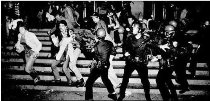
세계적 저항 물결 속에서 벌어진 스톤윌 항쟁