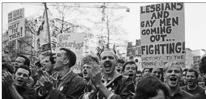
1904~85년 영국 광원 대파업과 연대한 동성애자들

지냈다. 유대인 마을은 공격받기 일쑤였고 인종청소를 당하기도 했다. 유럽을 통틀어 러시아만큼 맹목적인 유대인 혐오가 심각한 지역이 없었다. 그럼에도 1905년 혁명과 1917년 2월 혁명과 10월 혁명 당시 러시아 노동자들이 투쟁 속에서 건설한 가장 중요한 기구인 노동자평의회(소비에트)는 유대인인 트로츠키를 지도자로 선출했다. 1917년 후반 노동자 소비에트에서 다수의 지지를 받은 볼셰비키의 지도자들 중에도 유대인이라고 익히 알려진 인물들이 있었다. 러시아 노동자들은 자신들의 권력을 수립하는 과정에서 수 세기 동안 이어지던 편견을 극복해 냈다.