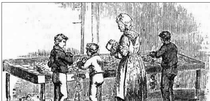
초기 산업화는 여성과 아이까지 공장으로 끌어들이며 전통적 가족을 해체했다

방법이라고 갈수록 확신하게 됐다. 19세기 중반 이후로 노동계급의 안정적인 가족 생활을 되살리려는 의식적 노력이 전개됐다. 그에 따라 여성과 아동은 특정 분야의 일자리에서 점차 배제되고 일부 남성 노동자들이 '가족 임금'을 지불받았다. 여성들은 특히 가임 능력에 악영향을 주는 산업에서 배제됐다.