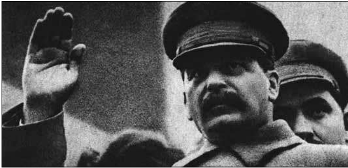
스탈린주의는 성 해방을 향해 러시아 혁명이 이론 성취를 파괴했다

파를 전적으로 지배하다시피 했다. 둘 모두 성에 관한 이론과 실천에서 반동적 태도를 취했다. 공산당은 앞서 언급한 소련에서 온 사상에 온통 몰들어 있었다. 노동당은 감리교회와 '품격 있는 노동계급'과 오랫동안 결부돼 왔다. 일체의 성적 '일탈'이 지배계급적 또는 중간계급적 타락으로 간주됐다.